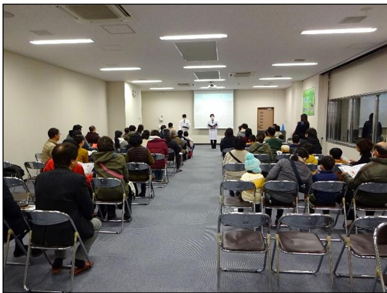
さあ、クリセン大学の講義が開始です