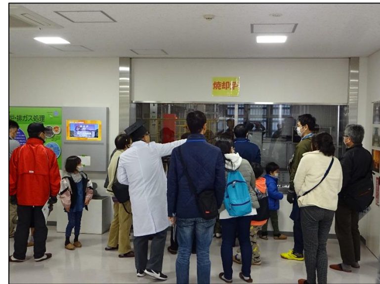
焼却炉の構造を説明