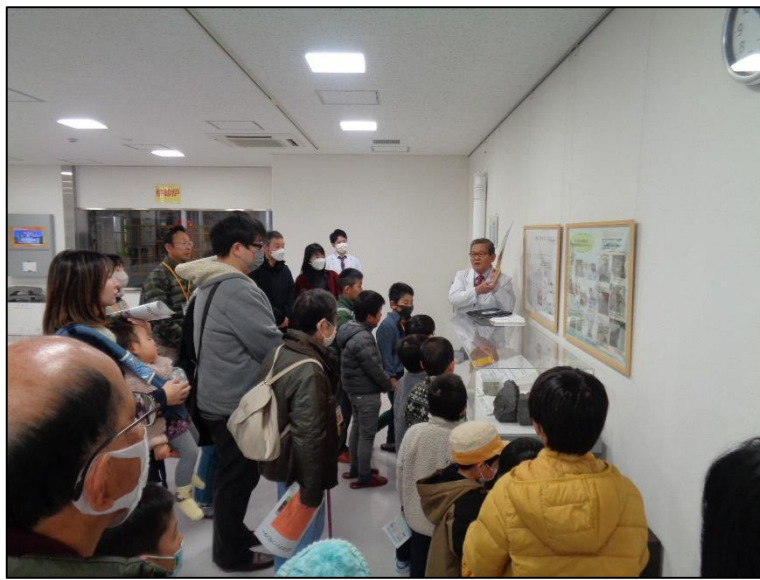
焼却灰等の資源化の説明