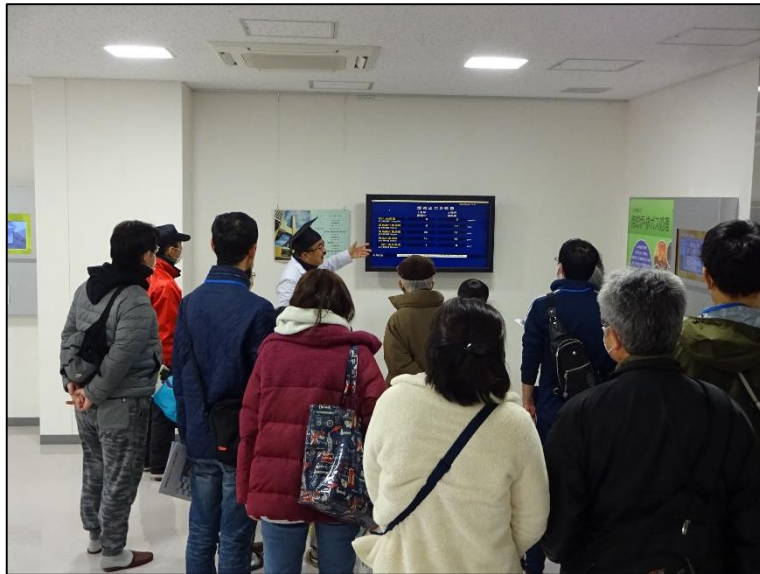
排ガス測定値の説明