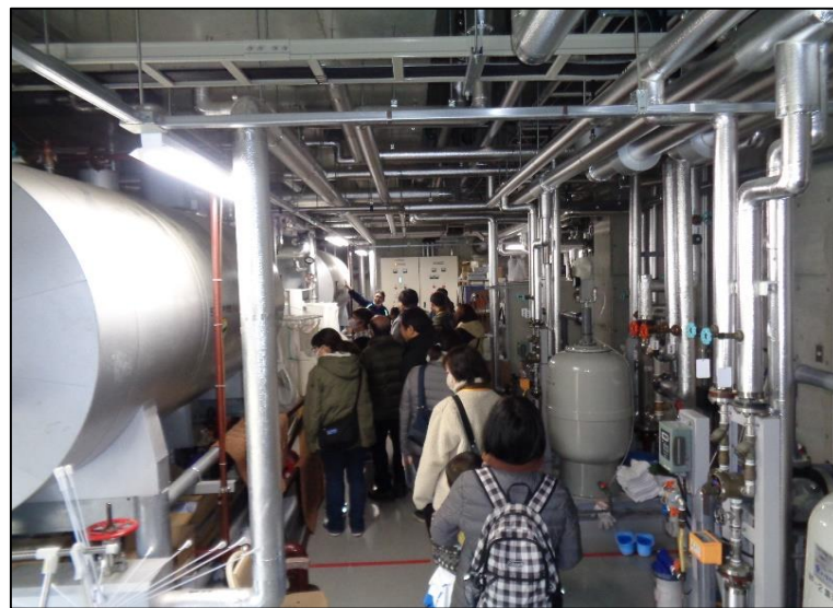
名水はだの富士見の湯の機械室