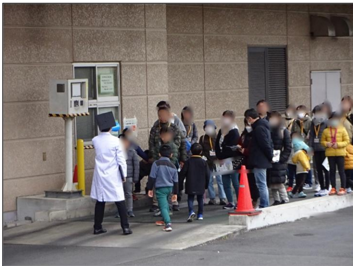
みんながのっているところが、ごみ収集車の重さを量るところだよ！【出口計量器】