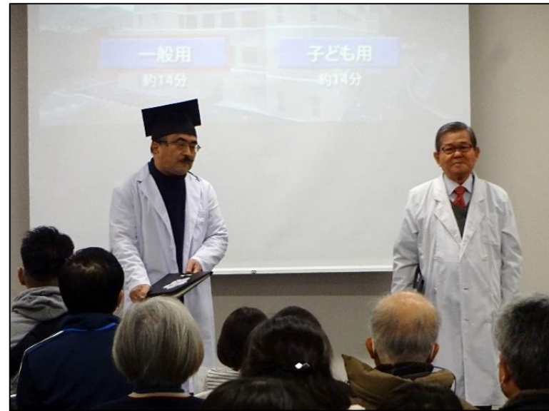
ごみ処理博士のあいさつ【大会議室】