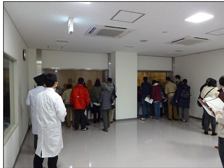
クレーンがつかむごみの重さは 何キロ？ クイズにチャレンジ！【ごみピット】