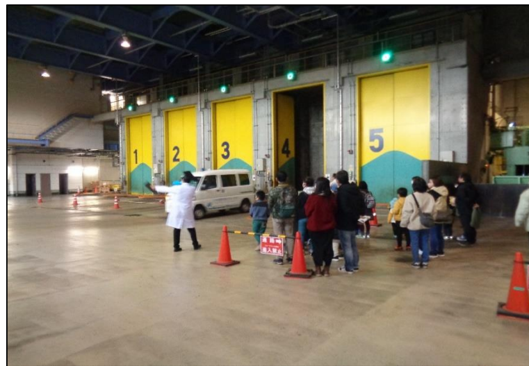
ごみを降ろすプラットフォーム 自動で4番扉が開いたよ